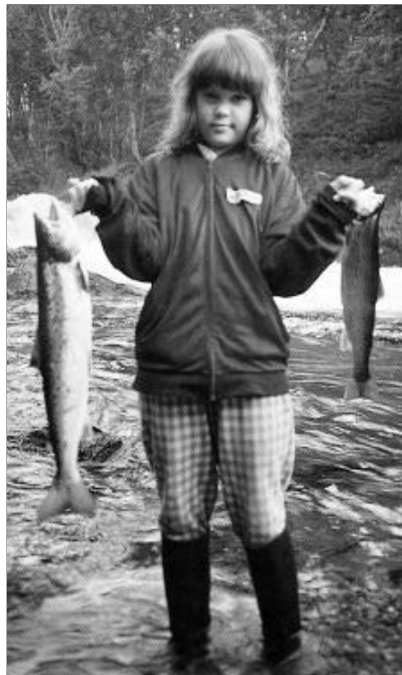
Fritidsfisket gir bedre livskvalitet, naturforståelse og trivsel.

«Ferskvannsfiskeforvaltning og fritidsfiske. En samfunnsfaglig kunnskapsoversikt.»